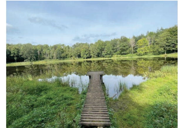
Windsborn-Kratersee am Mosenberg